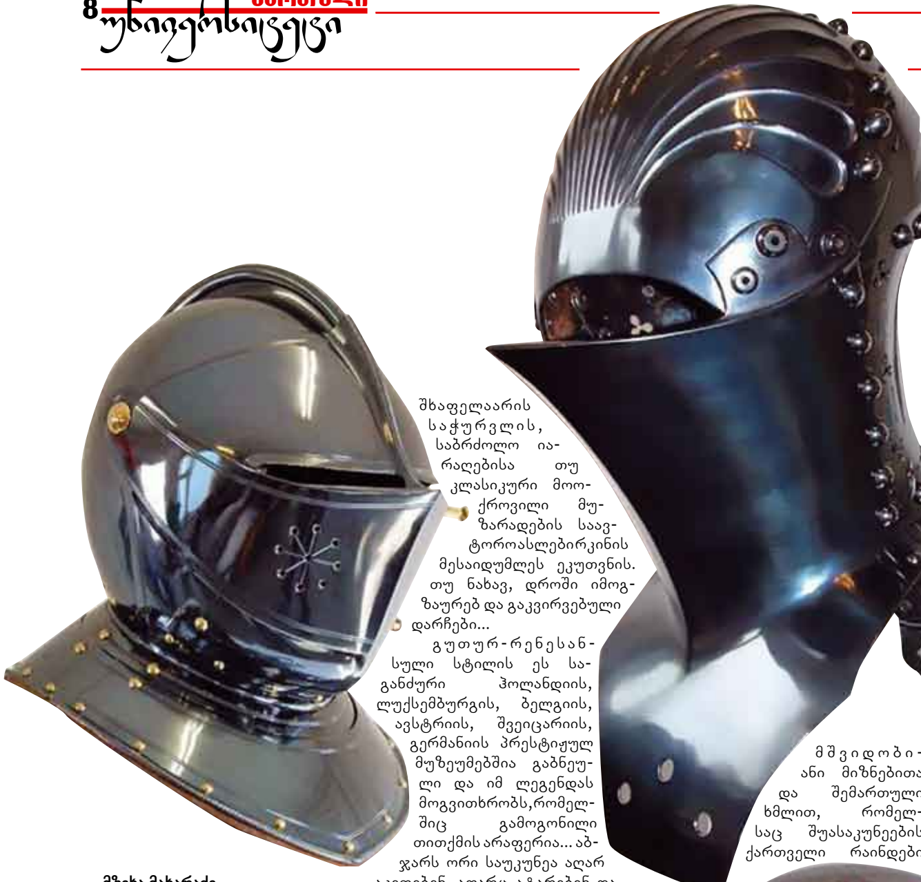
შხაფელარის საჭურვის, საბრძოლო იარაღებისა თუ კლასიკური მოიქროვილი მუზარადების საავტორალსებირკინის მესაიდუმლეს ეკუთვნის. თუ ნახვ, დროში იმოგზაურებ და გაეკრევებული დარჩები...