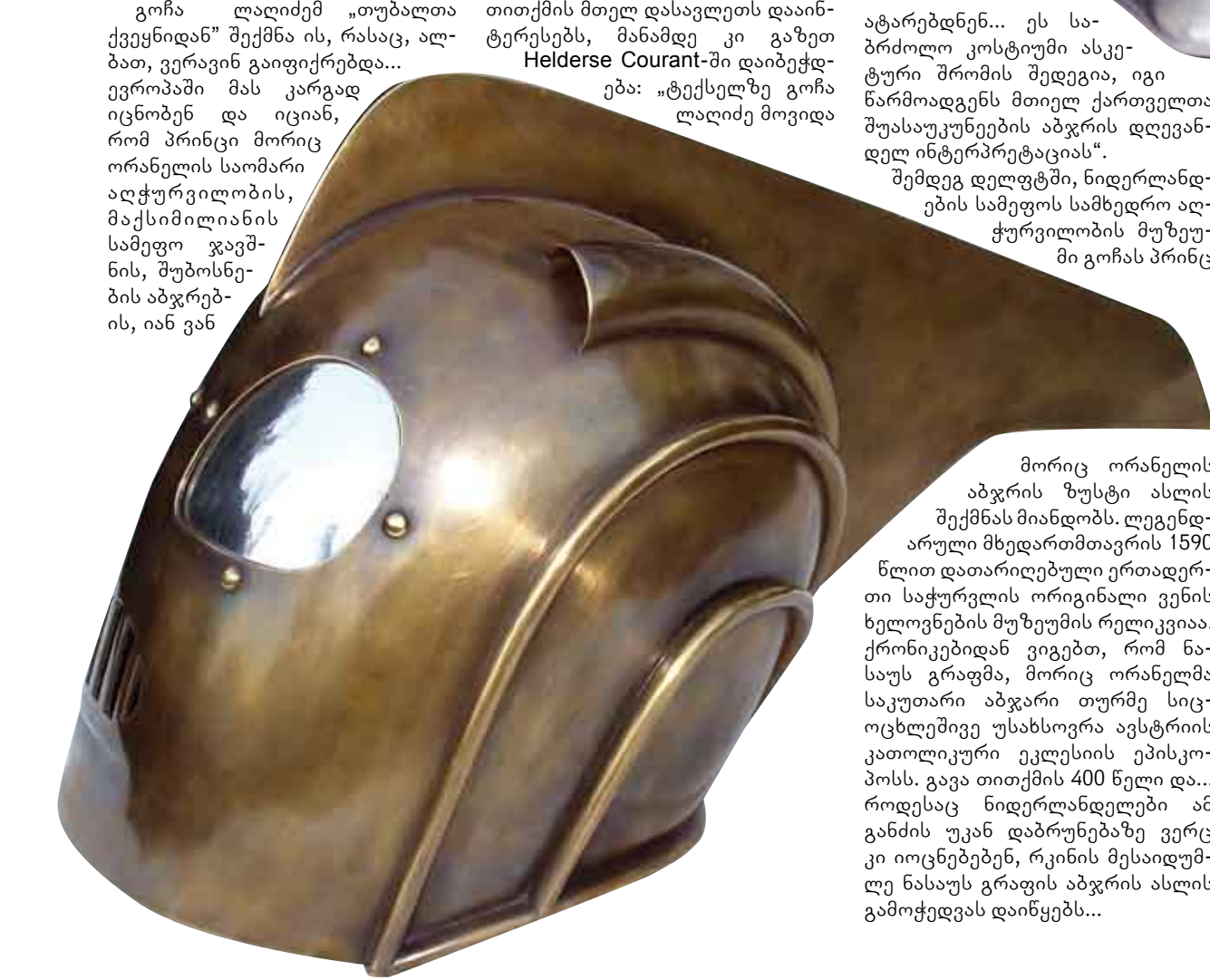
მორიც ორანელის აბაფურის ზუსტი ასლის შექმნას მიაღწიოს. ლევენარული მხედართმთავრის 1590 წლით დათარიღებული ერთადერთი საჭურვილის ორიგინალი ვენის ხელოვნების მუზეუმის რელიკვიაა. ქორნიკებიდან ვიგებთ, რომ ნა-საუს გრაფმა, მორიც ორანელმა საკუთარი აბაფური თურმე სიცოცხლეშივე უსახოვრა ავსტრიის კათოლიკური ეკლესიის ეპისკოპოსს. გავა თითქმის 400 წელი და... როდესაც ნიდერლანდლები იმ განძის უკან დაბრუნებულ ვერც კი იოცნებებენ, რკინის მესაიდუმლედ ნასაუს გრაფის აბაფურის ასლის გამოქვეყნებას დაინყებენ...

გონა ლალიძემ „თუბალთა ქვეყნიდან“ შექმნა ის, რასაც, აღბეინ, ვერაინ ვიციფურება... Heideres Courant-ში დაიბეჭდებოდა: „ტექსტულ გონა ლალიძე მოვიდა“